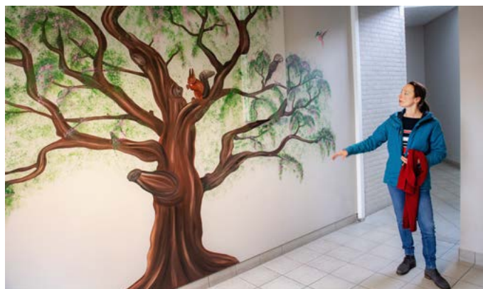
De nieuwe muurschildering in de hal van het wooncomplex.