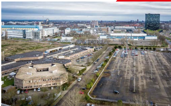
Linksonder op de foto het nieuwe kantoor van Talis.