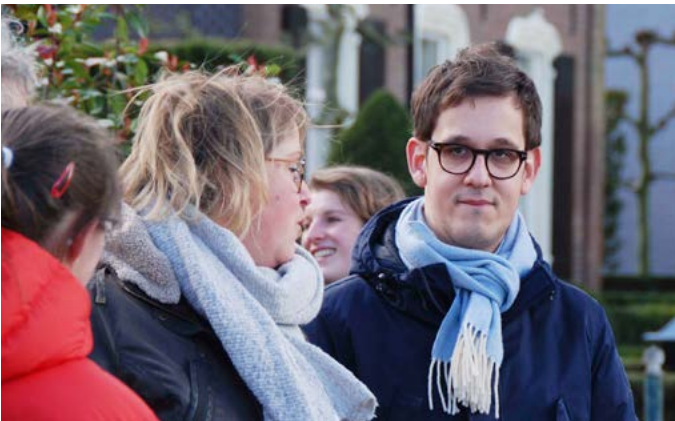
In Wijchen komt een wooninitiatief voor jongeren met een beperking aan de Kasteellaan.