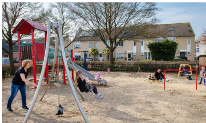
Lindenholt is ruim van opzet.