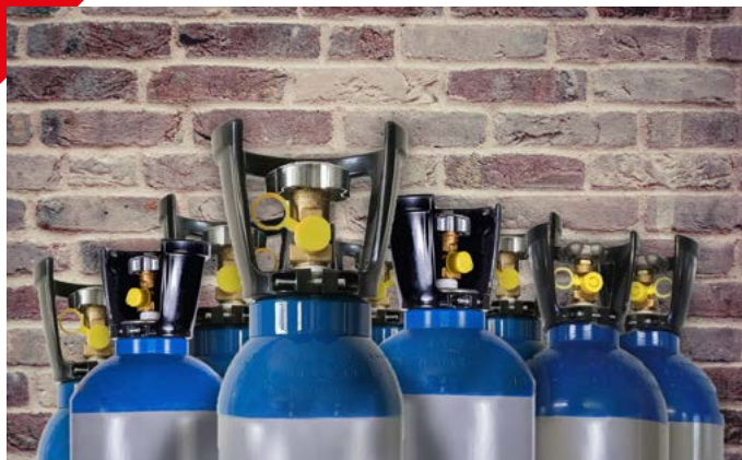
Flessen met lachgas zijn brandgevaarlijk.

Collega-corporatie Woongenoot heeft ons benaderd om te kijken of we en samen verder kunnen gaan. Wij zien daar de meerwaarde van in. We vinden allebei betaalbaarheid belangrijk en willen graag zichtbaar en aanwezig zijn in de wijken. De woningen van Talis en WoonGenoot liggen in verschillende wijken naast elkaar en samen kunnen we werken aan onder andere de leefbaarheid en de kwaliteit van de woningen. Op dit moment loopt het onderzoek naar de fusie. Het belangrijkste doel is om te onderzoeken of het samengaan van toegevoegde waarde is voor de huurders en woningzoekenden van beide organisaties. Hierbij betrekken we onze huurdervereniging Accio en de huurdersvereniging van WoonGenoot. Het doel is om per 1 januari 2022 als één corporatie verder te gaan.