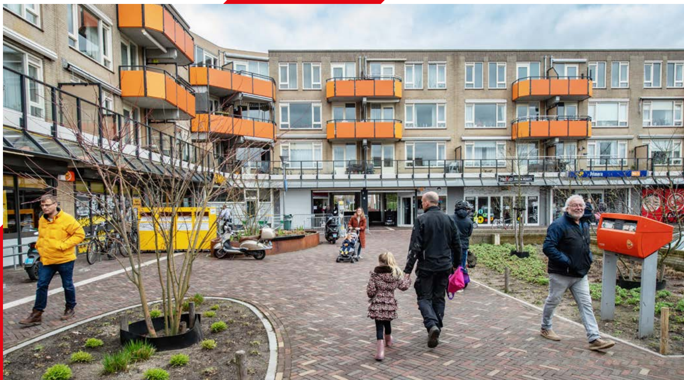
Het vernieuwde aanzicht van winkelcentrum Leuvenbroek.